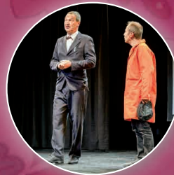
Lapsus präsentiert Frische Comedy und freche Beats Mi. 6. Mai 2026